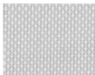
MS.300.305 Blanco-Gris perla